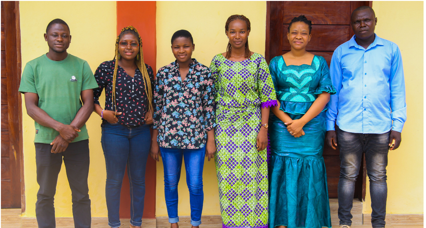
Les six (06) boursiers de RISE BENIN Abomey-Calavi, mai 2023

RISE BENIN : Le projet RISE Bénin octroie 6 bourses de recherche aux étudiants du Bénin (4 bourses de master dont un à l'UdeM et 2 bourses de thèse)