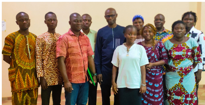
Vue des participants à la formation des enquêteurs Abomey-Calavi, du 14 au 15 février 2023

L a salle de conférence du Centre de Pédagogie Universitaire et d'Assurance Qualité (Cpuaq) de l' Université d'Abomey-Calavi (UAC) a abrité l'atelier de formation du personnel de terrain (agents enquêteurs) du 14 au 15 février 2023. Cette formation a eu lieu dans le cadre de la mise en œuvre du projet RISE BENIN , avec le financement du CRDI, Instituts de recherche en santé du Canada et le Conseil de recherche en sciences humaines du Canada .