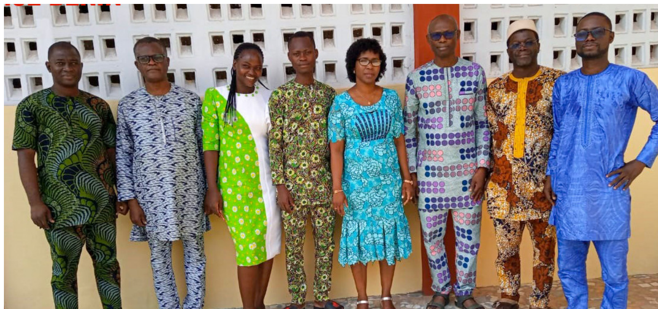
Vue des participants à la séance de planification Abomey-Calavi, le 03 mars 2023

P our le bon fonctionnement et l'atteinte des objectifs du projet, les acteurs se sont réunis le vendredi 3 mars 2023 pour planifier les différentes activités à exécuter. L'occasion a permis à chaque section de la mise en œuvre du projet d'exprimer et d'élaborer ses besoins en matériels de travail. La salle de réunion du bâtiment du Centre Autonome de Documentation d'Information de Recherche en Droit Santé Sexuelle et Reproductive du campus de l' Université d'Abomey-Calavi (CADIR-DSSR), a servi de cadre pour cet atelier très important pour le projet « RISE BENIN » financé par l'Initiative Les femmes S'ÉLÈVENT , le CRDI , Instituts de recherche en santé du Canada et le Conseil de recherche en sciences humaines du Canada .