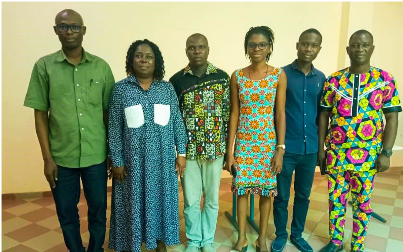
Vue des participants à la séance de présentation Abomey-Calavi, le 04 février 2023

Le samedi 04 février 2023, le Coordonnateur du projet RISE BENIN s'est entretenu avec son personnel et les parties prenantes. L'objectif est de faire une présentation détaillée du projet. Cette séance d'échange a eu lieu dans la salle de conférence du Centre de Pédagogie Universitaire et d'Assurance Qualité (Cpuaq) de l' Université d'Abomey-Calavi .