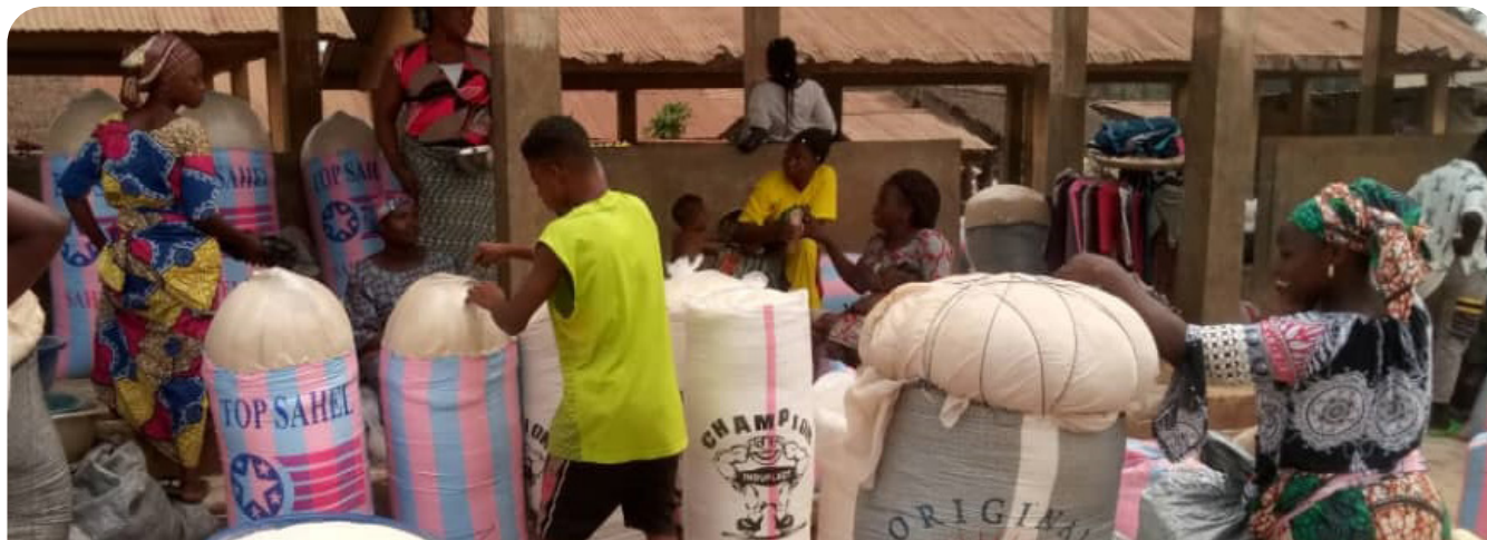
Vue d'un hangar de femmes productrices et vendeuses du farine de manioc (gari) au marché d'Ikpilè Enquête de terrain, Ikpilè mars 2023

« L'entrave à la libre circulation des biens et des personnes en période de Covid-19, a menacé des acquis en termes d'égalité de genre ». C'est ce que révèlent les données d'une enquête exploratoire réalisée en février 2023 auprès des organisations professionnelles de femmes et d'hommes du Sud-Benin ainsi que des institutions d'appui à la protection des femmes. Cette étude s'inscrit dans le cadre de la mise en œuvre du projet de recherche « RISE BENIN » financé par l'initiative "Les femmes S'ÉLÈVENT", (santé et bien-être économique pour une reprise post Covid-19, inclusive, durable et équitable), le Centre de Recherches pour le Développement International (CRDI) , les Instituts de recherche en santé du Canada et le Conseil de recherche en sciences humaines du Canada .